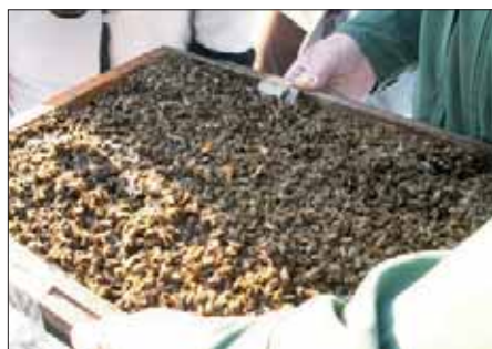
Wer dem Mäusegitter Fluglochkeile vorzieht, muss bei Flugwetter auf Verstopfung mit toten Bienen kontrollieren. Sonst droht Verbrausen.

beliebten) Eindruck, sie würden deren Tod herbeiführen. Dieser Bienenschwund ist nur für den einen oder anderen Großimker und US-Amerikaner „mysteriös“, dem aufmerksamen Hobby-Imker in „Good Old Europe“ ist er schon lange bekannt. Die wenigsten Todesfälle bleiben nach dieser Analyse ungeklärt. Beruhigend, denn meist sind weder mysteriöse neue Krankheitserreger noch vom Imker nicht beeinflussbare Faktoren wie „Stress“, Monokulturen, Pflanzenschutz, Grüne Gentechnik oder Handstrahlung für eine Erklärung