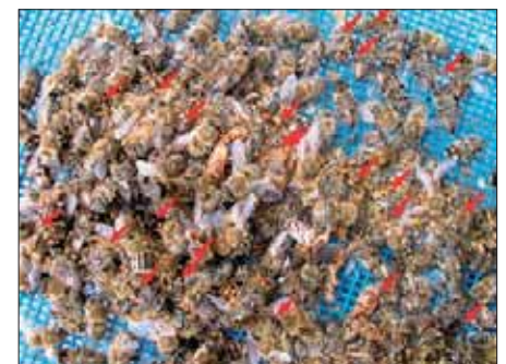
Typischer Varroa-Tod: ein jämmerliches Häuflein Bienen mit Königin auf einer Wabe und alte, nicht geschlüpfte Brutzellen. Im Totenfall sind bereits bei oberflächlicher Betrachtung verkrüppelte Bienen und mehr als 10 Milben (rote Pfeile) pro 100 Bienen zu erkennen.