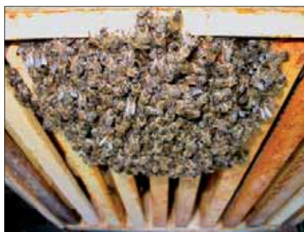
Wer von oben schwach aussieht, hat vielleicht tiefer liegende Vorzüge.

Wer keine Deckel heben oder Kästen ankippen möchte, erkennt bei Flugwetter (> 10°C, sonnig) die Wackelkandidaten auch am Flugbetrieb: Ohne vorherige Störung (kein Rauch, kein Verstellen der Flugschneise)