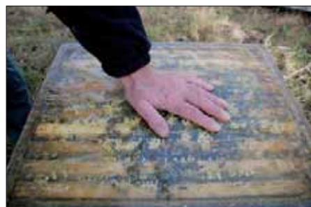
Die Temperatur verrät's: Dieses starke Volk auf 6 Wabengassen brütet bereits seit Weihnachten.

Das größte Sorgenkind des Bienenvaters sollte um diese Jahreszeit sein Nachbar sein. War der Winter lang anhaltend kalt, stehen die Bienen in den Startlöchern zum Reinigungsflug. Bis zur Hälfte ihres Körpergewichts haben sie an Kot gespeichert. Die geballte Ladung entsorgen sie bevorzugt auf Wäsche oder einem nach dem Frühjahrsputz erstrahlenden Auto. Eine kurze Warnung vor den stinkenden Spritzern, verbunden mit einem süßen Trostpflaster, hilft, den nachbarlichen Frieden zu erhalten.