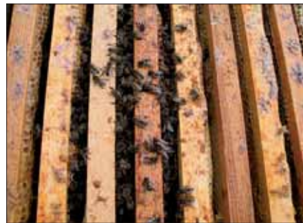
Typischer Hungertod: zahlreiche Bienen in den Wabengassen und keine verdeckelten Futterzellen.

In diesem Winter kam bereits VOR der Silvester-Party bei etlichen Imkern der große Katzenjammer. Ein prüfender Blick in die Beuten fiel allzu oft nur noch auf ein Häuflein Elend. Vor Einsetzen starken Flugbetriebes und möglicher Räuberei sollten diese wahrscheinlich inzwischen verstorbenen Völker abgeräumt werden. Das schützt sowohl den Frühjahrshonig als auch die Überlebenden vor unnötiger Belastung mit Krankheitserregern. Das gesamte Wabenwerk wird eingeschmolzen, die Rähmchen werden mit Natronlauge in der Spülmaschine gereinigt. Nur kotfreie Futterwaben werden aufbewahrt.