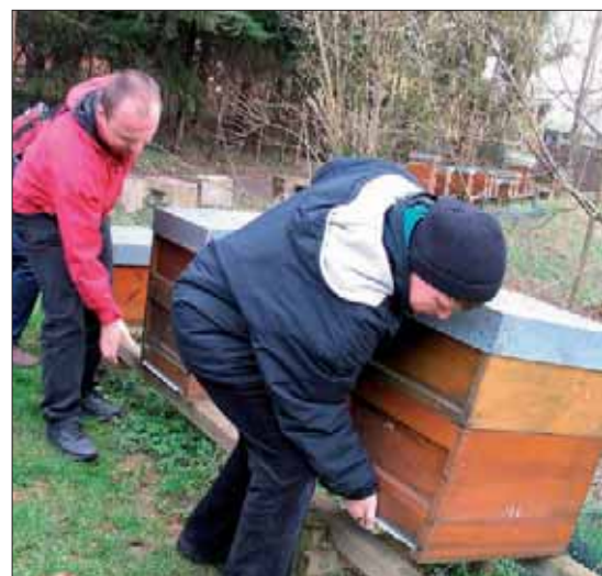
Mit etwas Erfahrung kann der Futterstand eines Volkes einfach an seinem Gewicht abgelesen werden (vorher Beschwerungsstein vom Deckel nehmen). Für Einsteiger empfiehlt es sich, den Futtermittelvorrat des leichtesten Volkes bei Flugwetter zu schätzen.